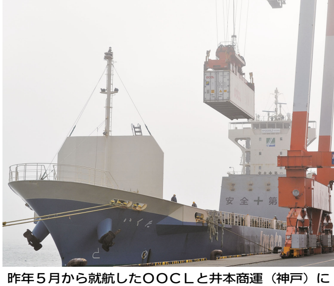
昨年5月から就航したOOCLと井本商運(神戸)による定期航路のコンテナ船

釧路港外国貿易コンテナ船 輸出入4年ぶり増加 前年比11%増、1万9493本 釧路港の港湾荷役を担う三ツ輪運輸によると、長く低迷していた釧路港の外国貿易コンテナ船の輸出入実績が、2024年(1~12月)は前年の1万7554本と比べ11.0%増の1万9493本(TEU・20ft換算)と、4年ぶりに増加に転じた。韓国・釜山と釧路港を結ぶ従来の南星海運に加え、昨年5月から大手国際海運のOOCL(香港)と大手内航海運の井本商運(神戸)による京浜港と釧路港を結ぶ定期航路が就航し、コロナ明けに伴う貨物の輸送需要も増大している。(郷裕策)