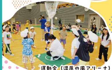
運動会(湿原の風アリーナ)

学校法人 文香学園 認定こども園 かすみ幼稚園 TEL(0154)23-4590