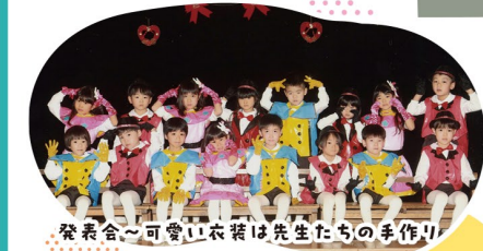
発表会～可愛い衣装は先生たちの手作り!