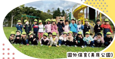
園外保育(美原公園)